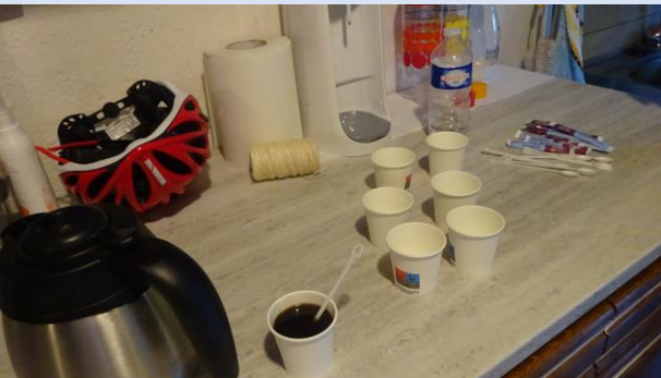
Café au départ

Départ 8h de VEZELOIS pour rejoindre CHILLY SUR SALINS, avec pause déjeuner à MONTBENOIT.