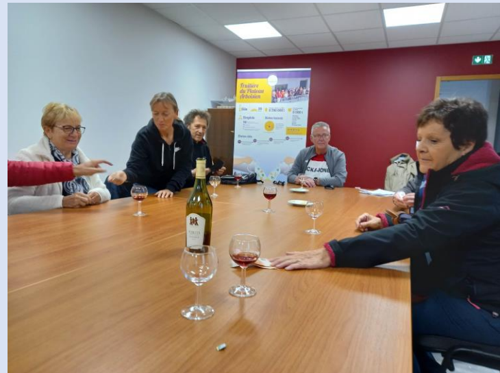
Visite ponctuée par la dégustation de comté et de morbier + vin du Jura bien sûr...